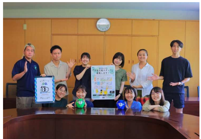
図3. 学生広報スタッフの活動の様子