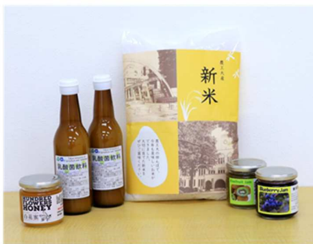
図2. 農工大つながるプロジェクト返礼品の一例

本学農学部附属広域都市圏フィールドサイエンス教育研究センターでは、実習を中心とした農産物の生産・収穫に加えて、様々な加工品の製造も行っています。学生や教職員が丹精込めて作った農産物や加工品を、是非ご堪能ください。